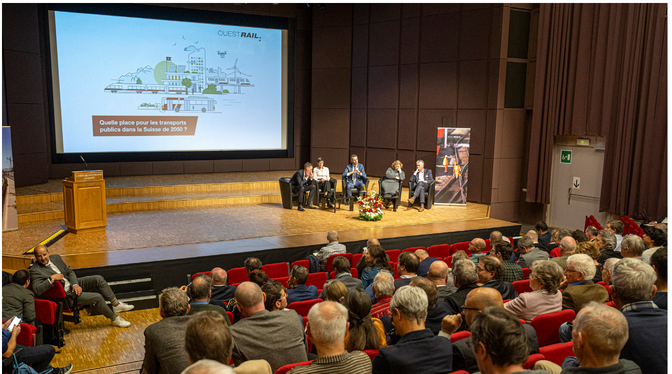
Un public nombreux pour cette 19 ème édition.