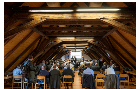
Plus de 100 participants s'étaient déplacés à Fribourg