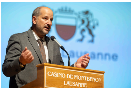
Grégoire Junod, Syndic de Lausanne, a transmis les salutations des autorités lausannoises