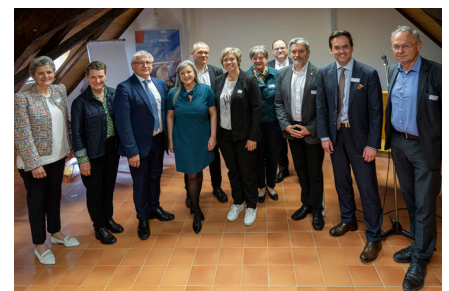
Les orateurs et élu(e)s présent(e)s à l'Assemblée générale 2023