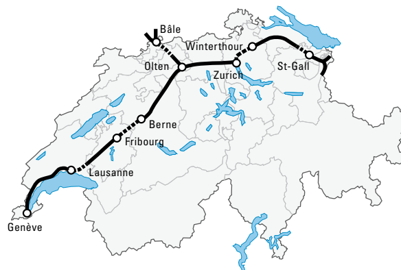
Projet NTF (1977).