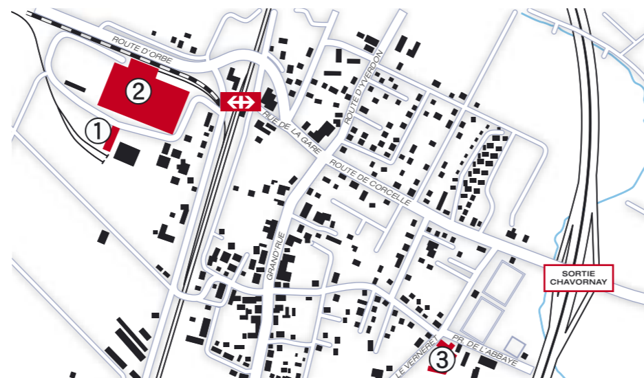
Le site de l'entreprise terco (1) se trouve derrière l'entreprise PESA (2). La grande salle communale (3) se trouve à l'angle de la Promenade de l'Abbaye et de la rue « Le Verneret ».

Pour accéder à la grande salle communale Le colloque aura lieu à la grande salle communale de Chavornay (cf. plan ci-dessous). Le transbordement entre l'entreprise TERCO, respectivement la gare de Chavornay, et la grande salle communale de Chavornay est organisé pour les personnes qui se déplacent en transports publics. Les autres personnes se rendent par leur propre moyen sur le lieu du colloque qui débute à 10h45.