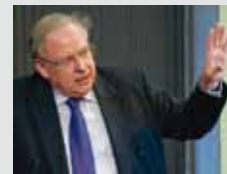
Le Conseiller national de la Neuveville Jean-Pierre Graber, toujours très à l'aise dans ses interventions