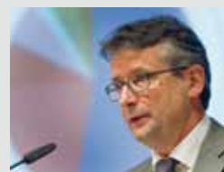
Pierre-André Meyrat, directeur suppléant de l'Office fédéral des transports OFT