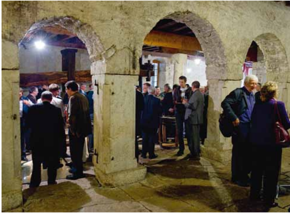
Moment de convivialité à l'issue de l'AG 2011 à la Cave de Berne de la Neuveville