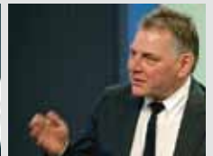
Egalement présent à la Neuveville, le Conseiller d'Etat du canton du Valais Jacques Melly