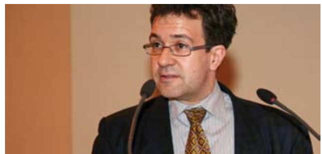
Markus Liechti, de l'OFT, a présenté les tâches du régulateur en relation avec le troisième paquet ferroviaire