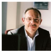
Technique Thierry WAGENKNECHT