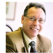
Développement & Ingénierie Pascal GANTY