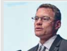
Olivier Baud, Office fédéral des transports OFT