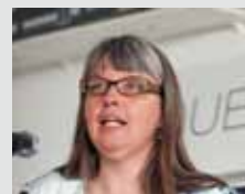
... puis de la Conseillère d'Etat du canton de Genève Michèle Künzler...