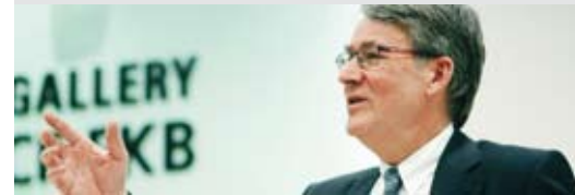
Le vice-président d'OUESTRAIL et Conseiller aux Etats Urs Schwaller a dirigé l'AG jusqu'à la nomination du Conseiller aux Etats Claude Hêche à la présidence d'OUESTRAIL