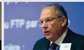
Jean-Pierre Graber, Conseiller national (BE) pour la vision de l'UDC