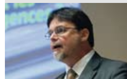
Robert Cramer, Conseiller aux Etats (GE) pour la vision des Verts