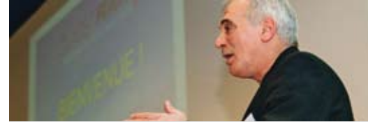
Le syndic de Fribourg Pierre-Alain Clément lors de son allocution en ouverture de l'AG