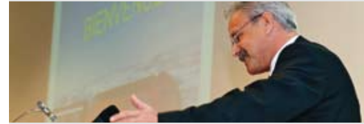
Beat Vonlanthen, Conseiller d'Etat du canton de Fribourg en charge des transports, a évoqué les efforts de son canton en matière de transports publics