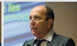
Jean-René Germanier, Conseiller national (VS) pour la vision des Libéraux - Radicaux