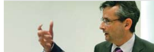
Pierre-André Meyrat, vice-directeur de l'OFT, a rappelé les mécanismes de financement du rail