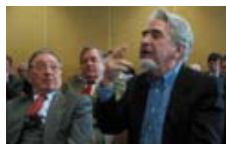
Le Maire d'Annemasse Robert Borel a exposé sa vision des transports publics