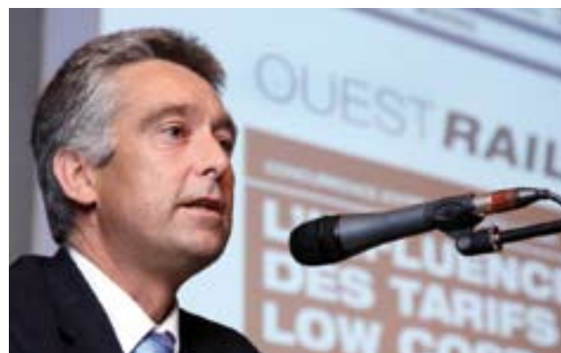
Toujours très présent dans les débats sur les transports, le Conseiller d'Etat François Marthaler participait également au colloque OUESTRAIL. Il préside actuellement la CTSS (Conférence des transports de Suisse occidentale).

Suisse occidentale. La mise au point du dossier bat son plein et le projet sera mis en consultation au printemps 2007. En fonction de l'état du projet à fin 2006, OUESTRAIL est d'avis que la mise à disposition des crédits doit être accélérée et ne pas attendre 2020 comme le prévoit le projet officiel. Par ailleurs, le montant prévu initialement pour RAIL 2000, qui constitue déjà un minimum, doit être octroyé pour les infrastructures ZEB, à savoir entre 7 et 8 mrd de francs et non 5 mrd seulement comme cela est prévu à fin 2006.